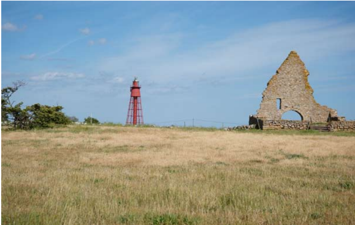
Kapelluddens fyr och S:ta Britas kapell, Mörbylånga