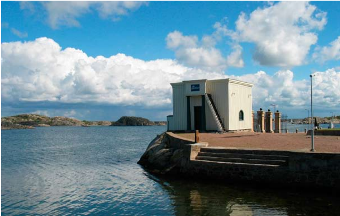
Parloiren, Stora Känsö