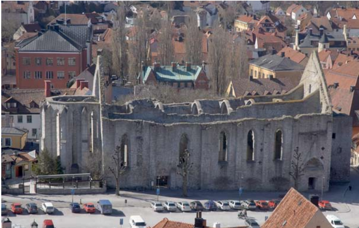
S:ta Katarina kyrkoruin, Visby