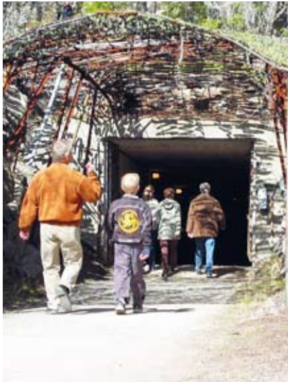
Hemsö fästning under Hemliga rum SFV