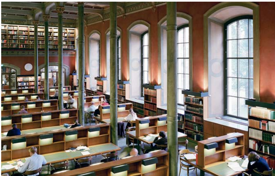
Kungliga biblioteket, Stockholm