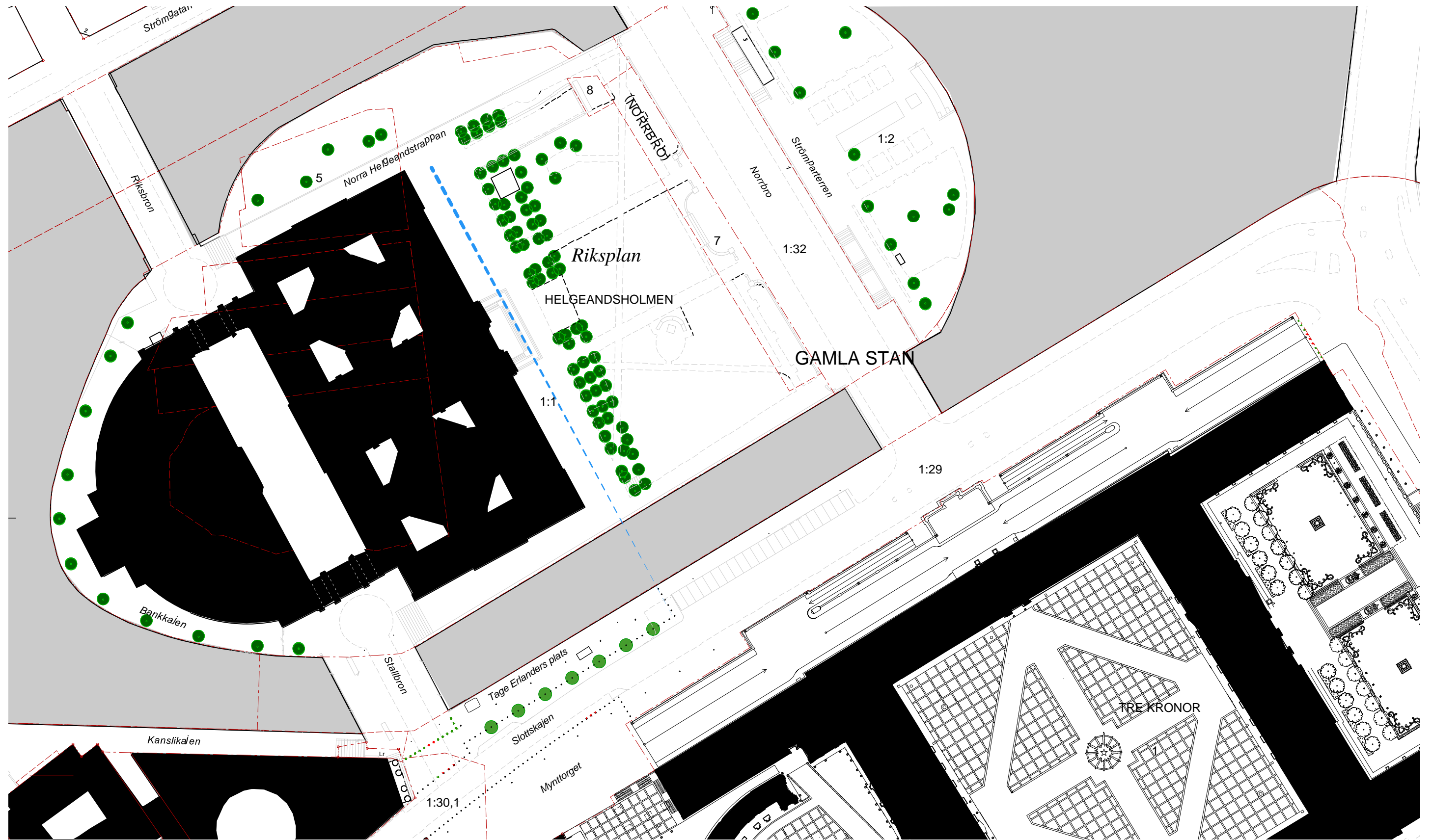
Situationsplan med träd. Helgeandsholmen, Mynttorget och Stockholms slott