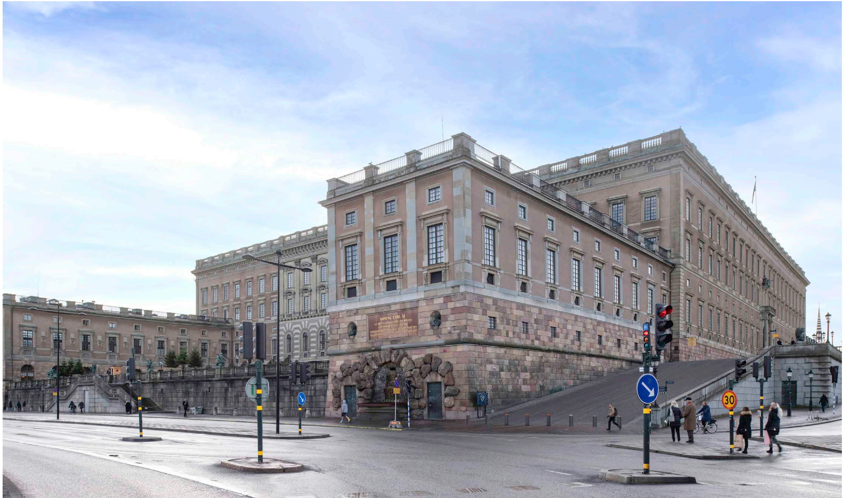
Renderad bild, vy från Skeppsbron mot Lejonbacken.