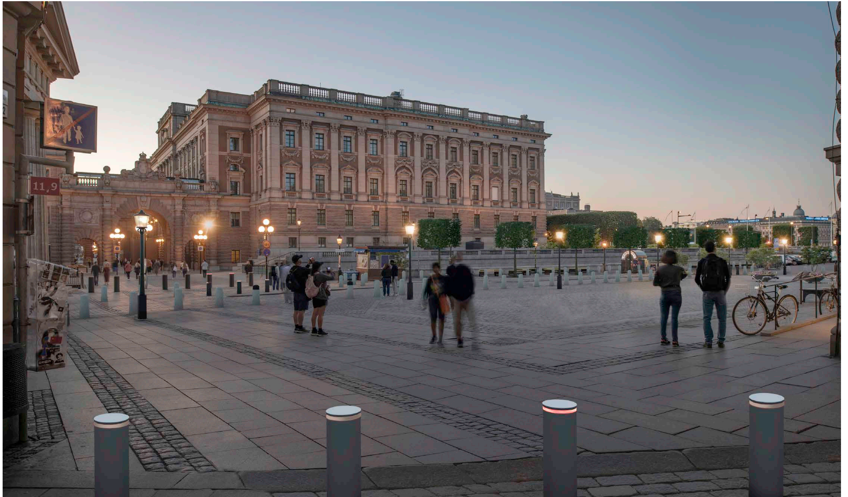
Renderad bild, vy från Västerlångatan mot Riksgatan