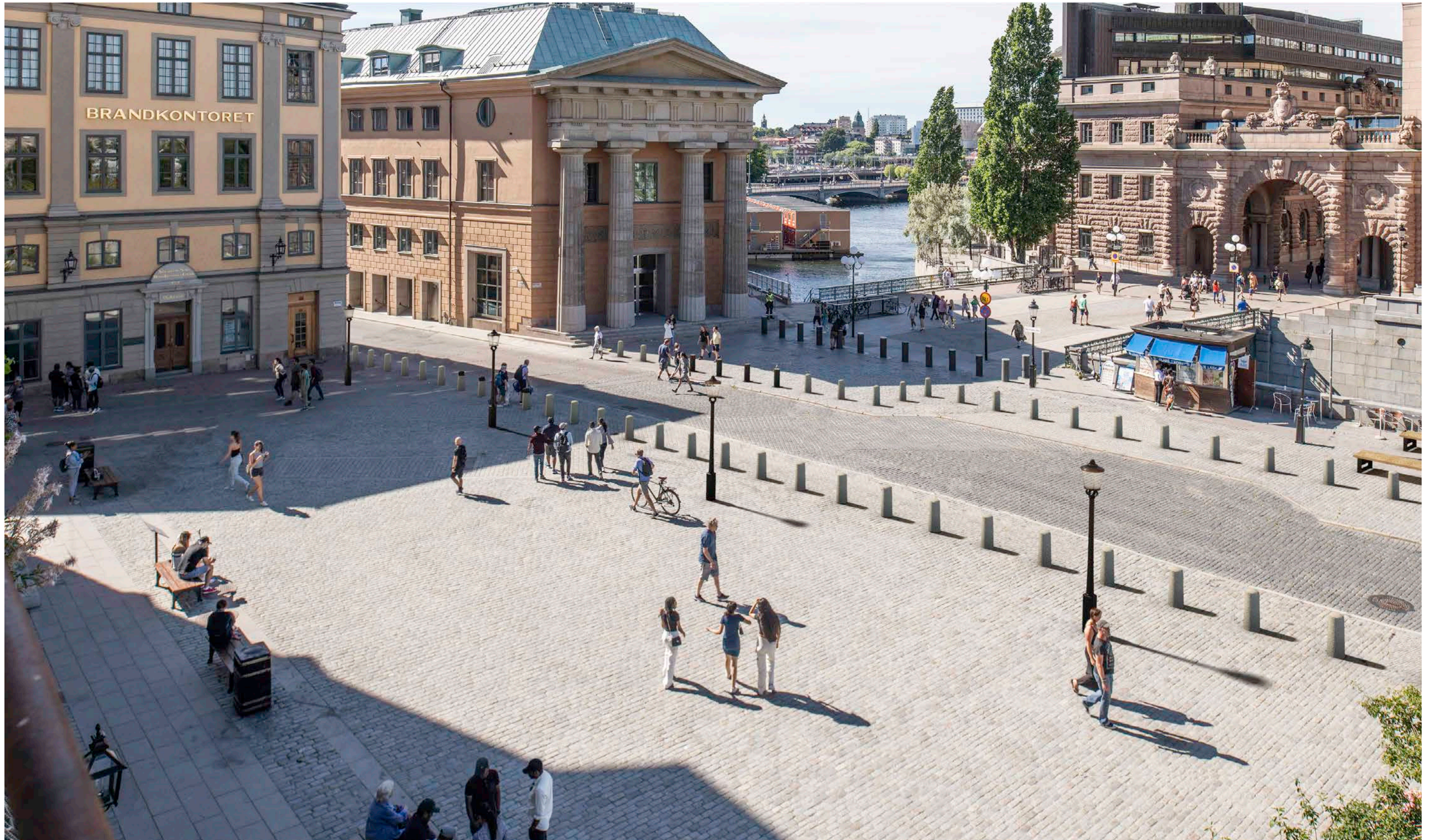
Renderad bild, flygbild Mynttorget, utan träd.