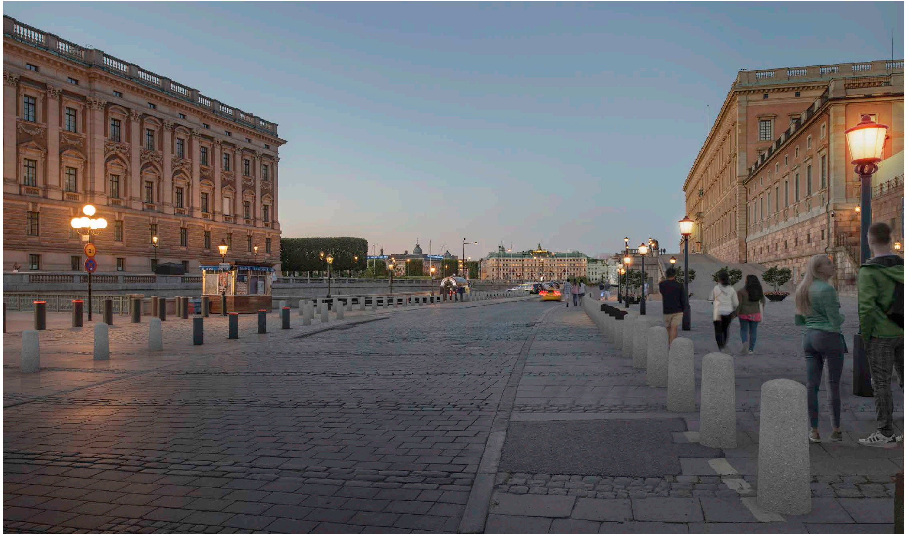
Renderad bild, vy från Mynttorget mot Norrbro utan träd.