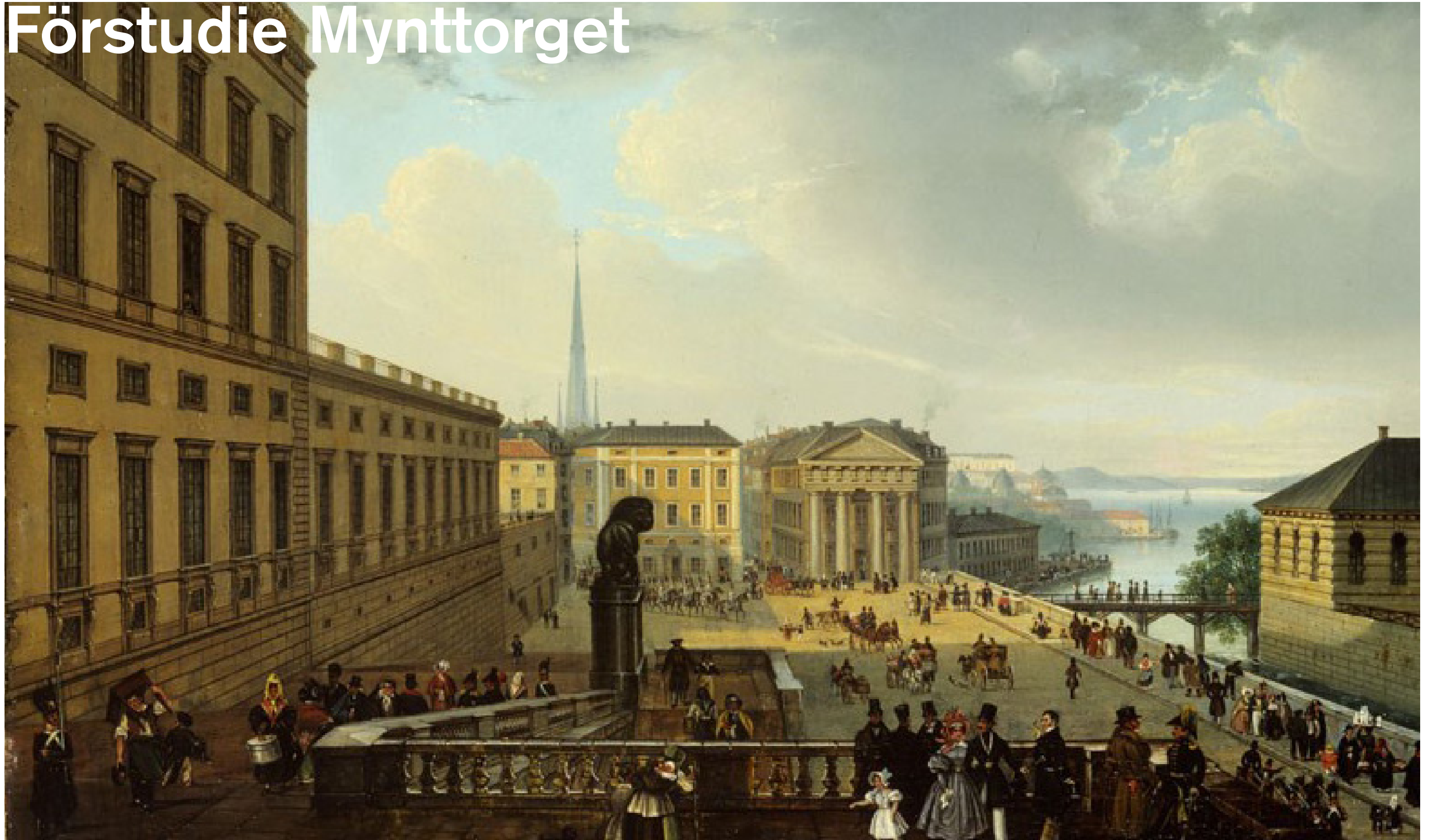
Kvarteret Tre Kronor, Oljemålning av Gustaf Söderberg, 1834