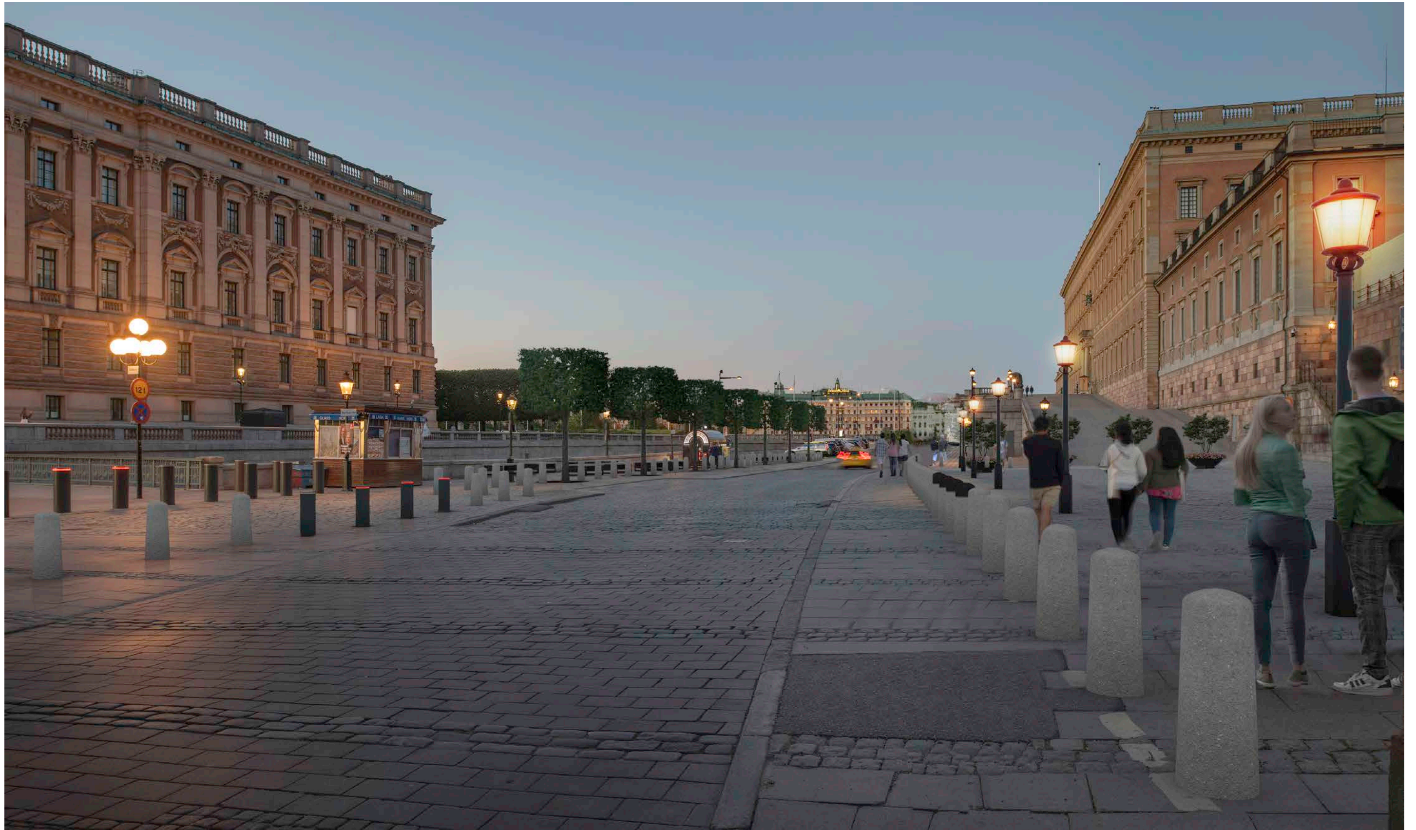
Renderad bild, vy från Mynttorget mot Norrbro.