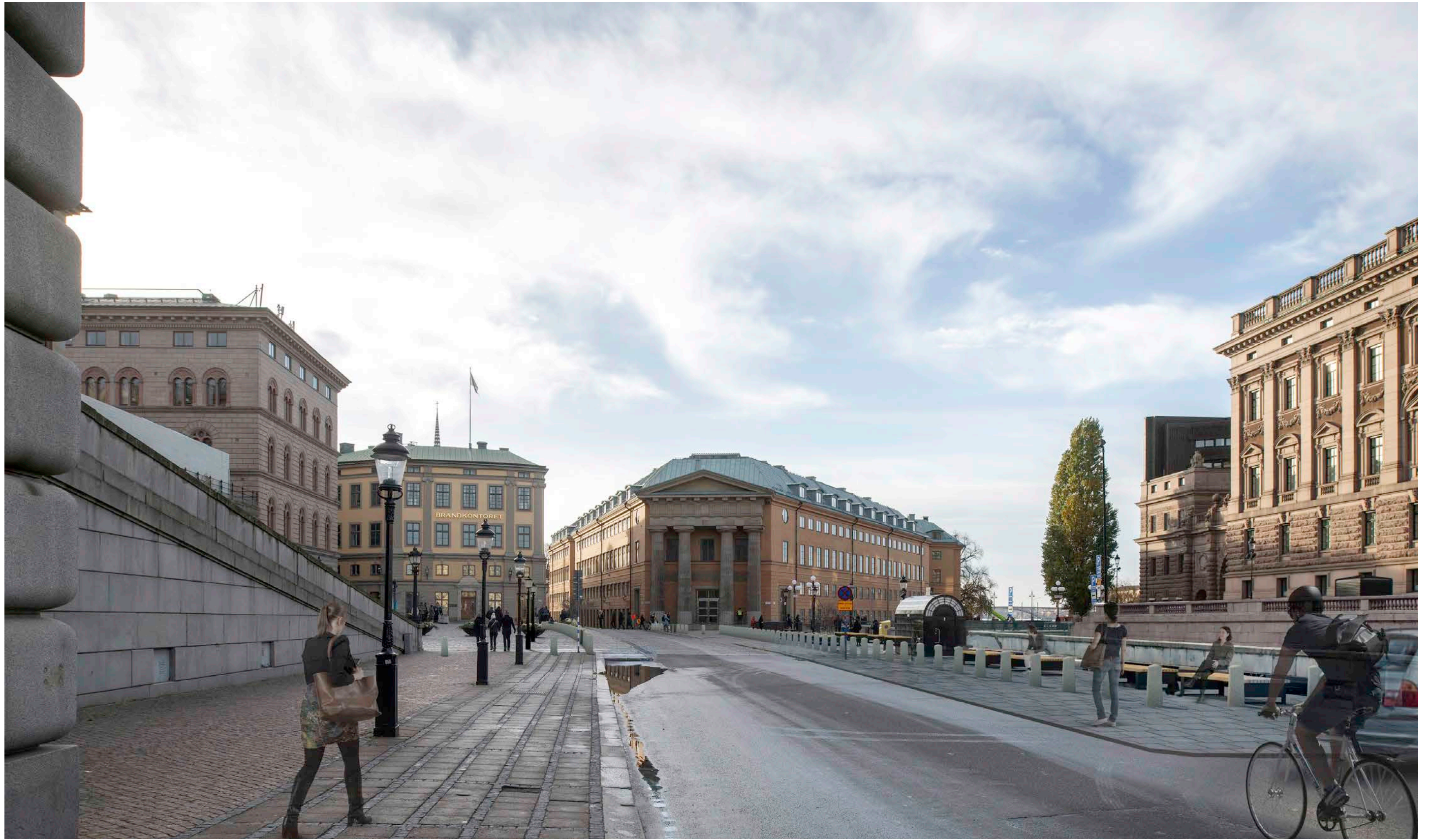
Renderad bild, vy från Slottskajen mot Myntgatan och kanslihuset utan träd.