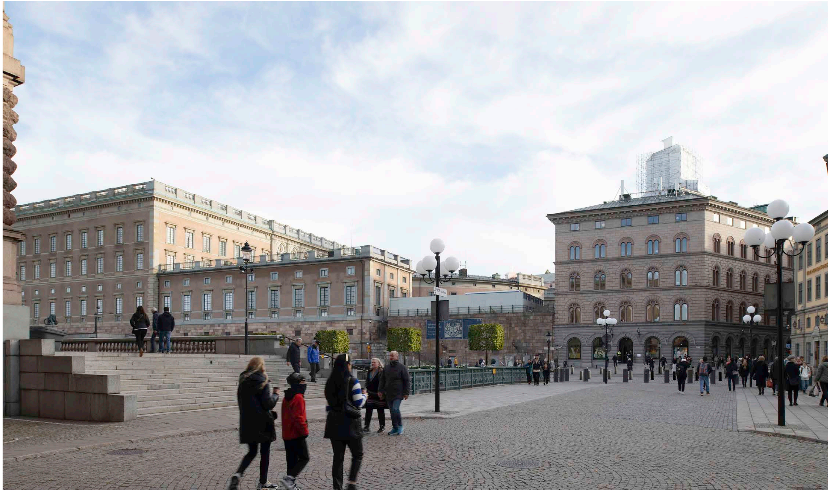
Renderad bild, vy från Riksgatan mot Mynttorget.