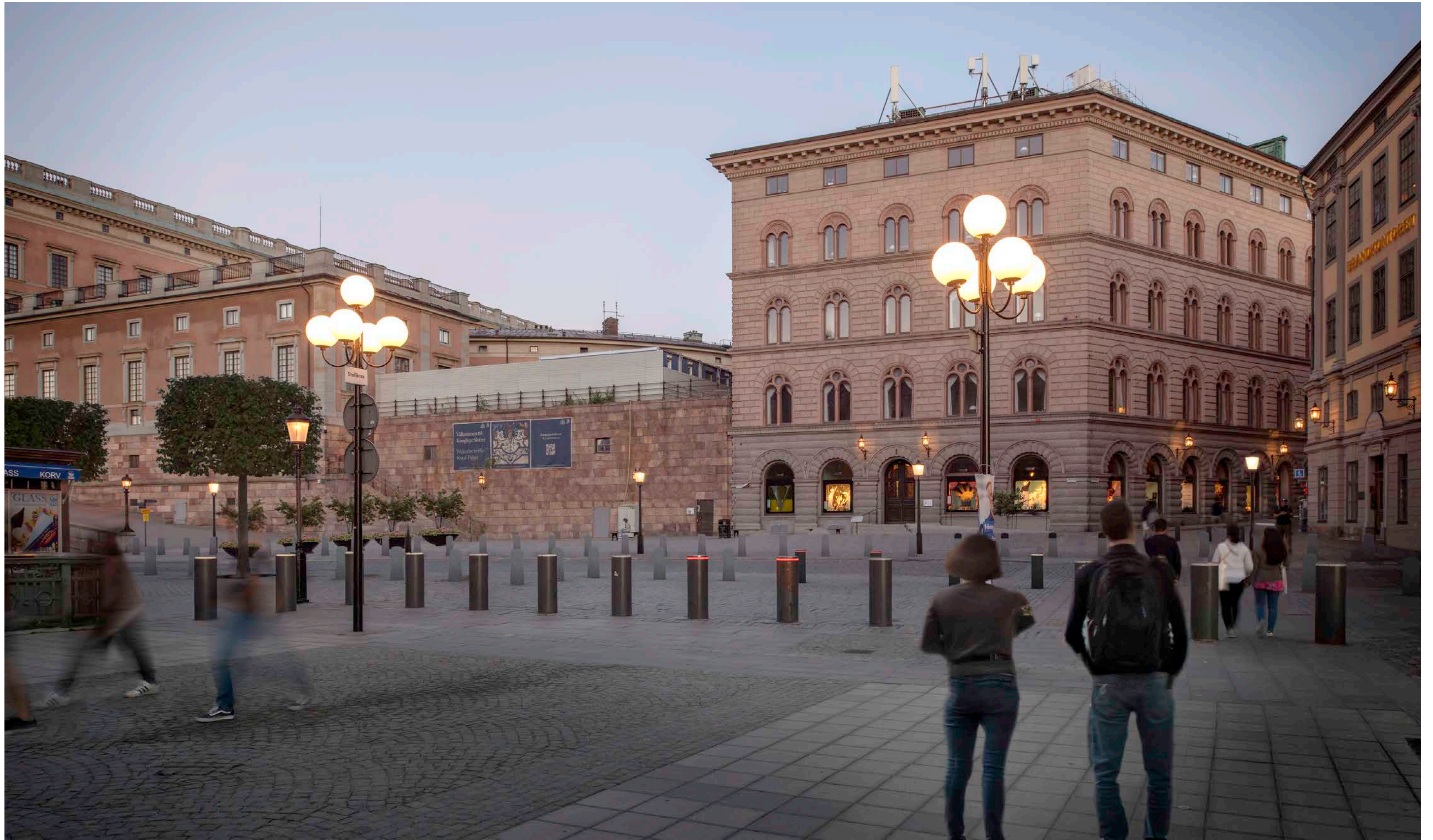
Renderad bild, vy från Riksgatan mot Mynttorget.