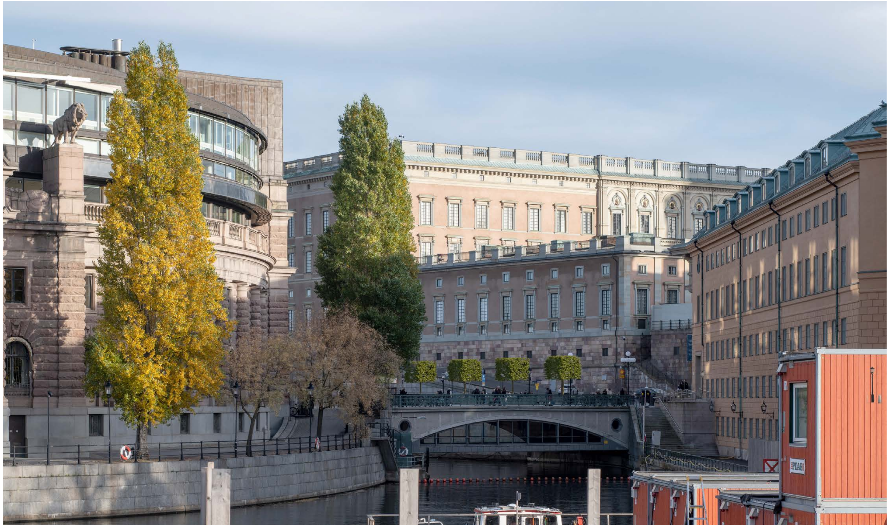
Renderad bild, vy från Vasabron mot Mynttorget.