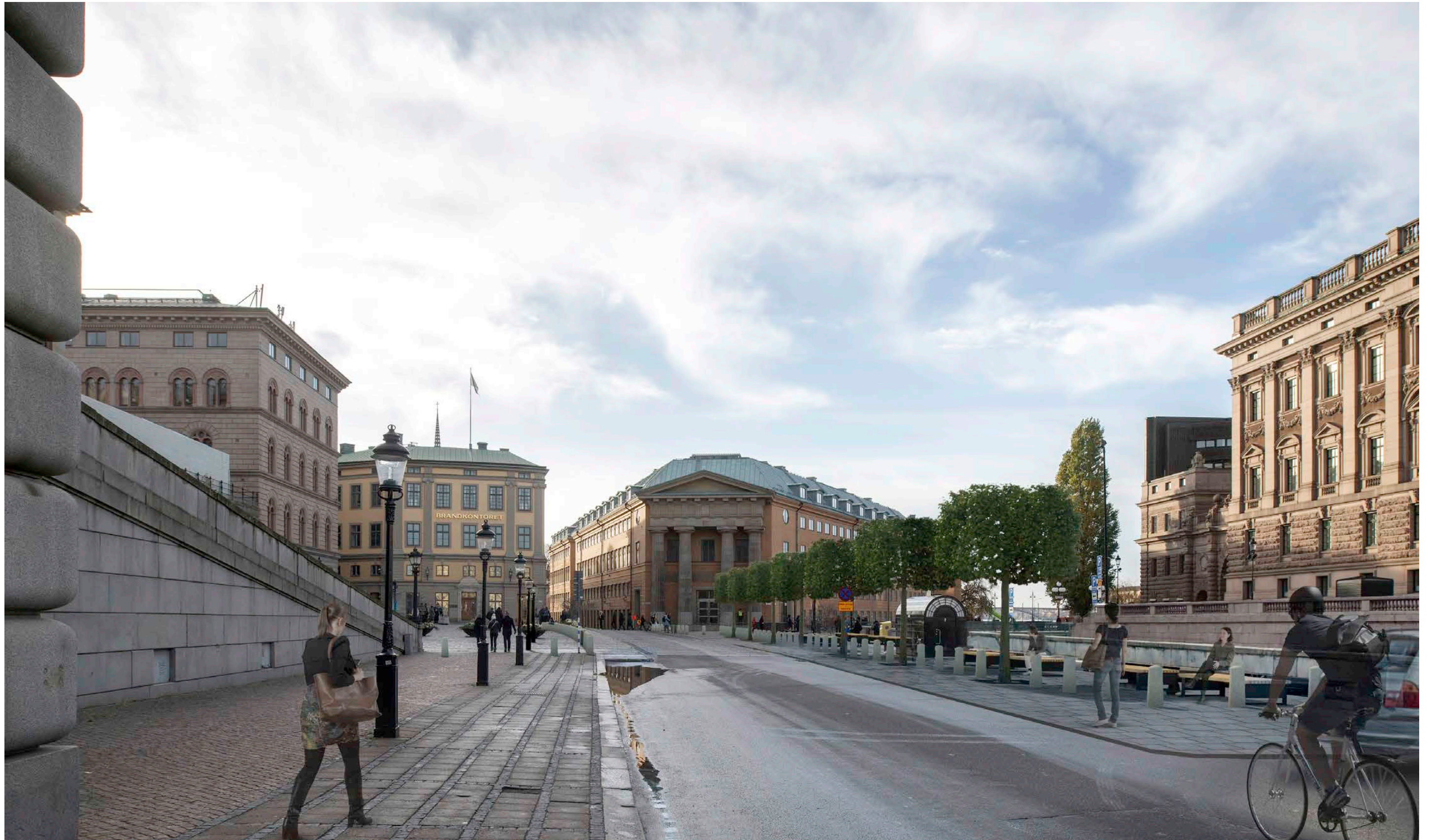
Renderad bild, vy från Slottskajen mot Myntgatan och kanslihuset.